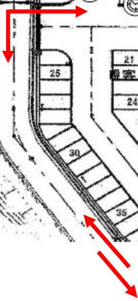
マルチフィールド出入口ゲート